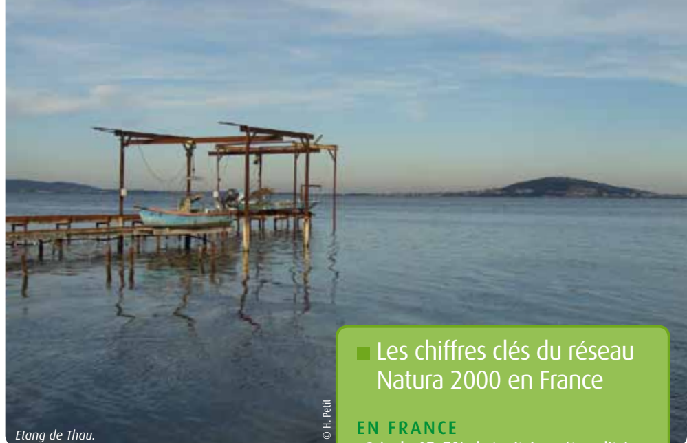
Etang de Thau.

Estimés « d'intérêt communautaire », ils