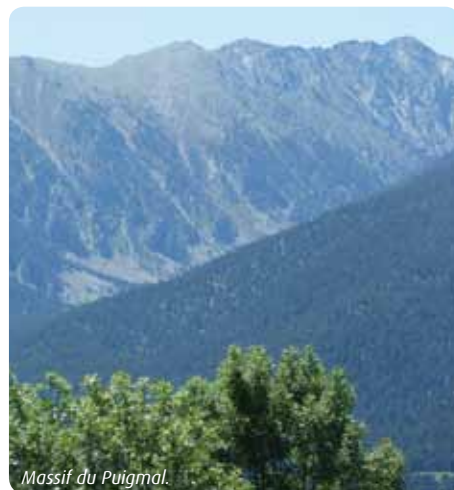
Massif du Puigmal.

rables sans interdire un usage, prendre simplement conscience d'un monde, celui des milieux et des espèces, et le respecter. Aujourd'hui, vingt ans après, les contestataires « historiques » sont devenus les premiers signataires des contrats et des chartes. Toutefois, les procédures choisies par la France pour la contractualisation, l'aspect le plus innovant de Natura 2000, restent un parcours de longue haleine et elles se mettent en place progressivement. Il faut informer, persuader, trouver les moyens financiers,