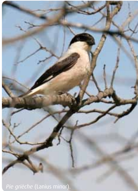
Pie grièche ( Lanius minor ).

Au niveau régional, elle est considérée comme une espèce en danger avec une population en déclin réduite à 15 - 17 couples depuis 2008. Les causes de cette régression spectaculaire sembleraient être liées premièrement à la dégradation de leurs sites d'hivernage