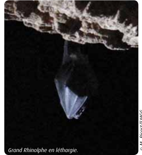
Grand Rhinolophe en léthargie.

Dans le cadre du LIFE chiromed, les actions concernent huit sites d'intérêts communautaires et recouvrent tous les stades du cycle biologique des deux espèces : la Camargue pour la période de reproduction, les Alpilles et les