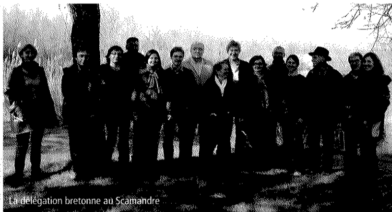
La délégation bretonne au Scamandre

Le jeudi 18 novembre dernier, le SMCG a invité les prestataires du tourisme du territoire pour une journée d'échanges sur le thème "Activités touristiques, mise en valeur et préservation du patrimoine". 35 acteurs du tourisme ont répondu présents. La matinée d'échanges a été riche et s'est poursuivie autour d'un buffet convivial suivi d'une visite de la Réserve naturelle du Scamandre. Une deuxième réunion a eu lieu en avril pour mettre en place un réseau d'acteurs du tourisme fédéré autour d'une démarche participative de valorisation du patrimoine local. Cette démarche doit s'articuler avec celle entreprise également sur ce thème par le Pays Vidourle Camargue ■