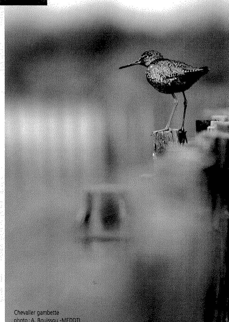
Chevalier gambette