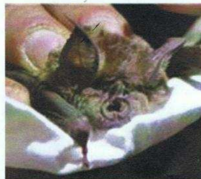
Le grand rhinolophe

Une des participantes, Véronique Hénoux, nous a fait parvenir quelques photos.