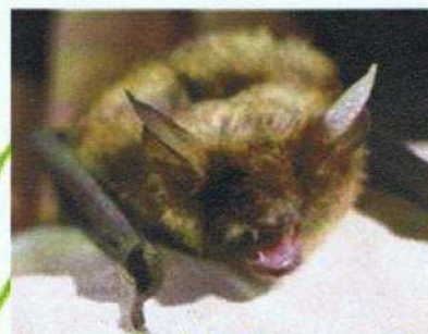
Le murin à oreilles échancrées

La Nuit de la Chauve-Souris s'est déroulée le samedi 28 août 2010 au Mas du Pont de Rousty, à partir de 18 h 00. Au programme, un atelier de fabrication de chauves-souris en papier avec l'Art du Trait, une conférence, un repas tiré du sac suivi d'une sortie nocturne.