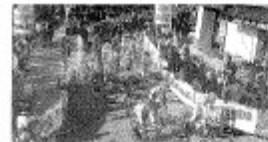
Place à la deuxième étape avec trois jours de circuit autour des Hautes-Provence. P.31